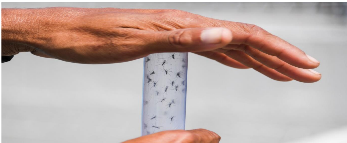
Aedes aegypti

https://www.terra.com.br/vida-e-estilo/saude/prefeitura-de-sao-paulo-prorroga-campanha-de-vacinacao-contragripe-por-tempo-indeterminado,0090359e476789b7d164136e938ec73e0ra1rcdk.html