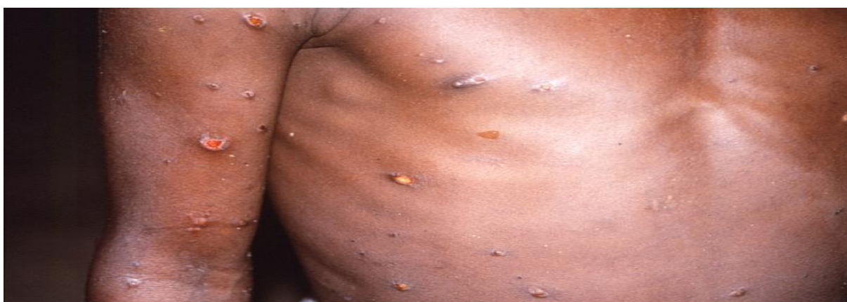
WJ Foto: CDC/Brian Mahy

Seleção de notícias de veículos de mídias e informações de órgãos públicos de abrangência internacional