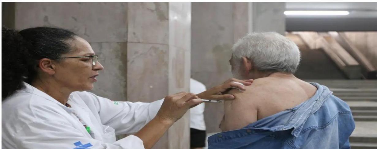
Ravena Rosa/ Agência Brasil